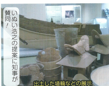
出土した道輪などの展示