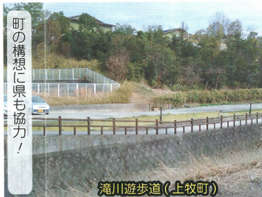
滝川遊歩道（上牧町）