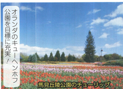
オランダのキュー・ヘンホフ公園を目標に充実！