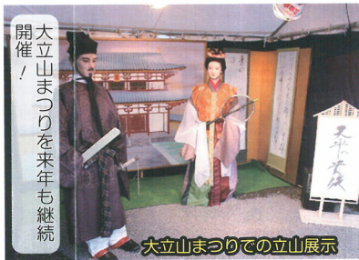
大立山まつりを来年も継続開催！