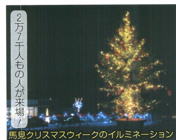
2万7千人もの方が来場！