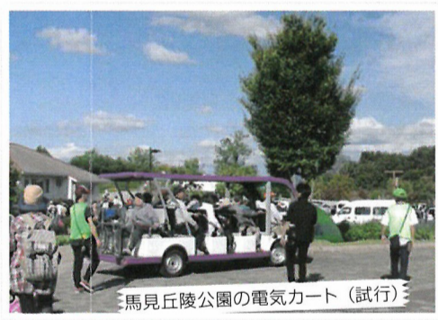
馬見丘陵公園の電気カート（試行）

な公園を利用して運動していただくことは、大変良いことであり、公園の歩行環境などをさらに整えてまいります。