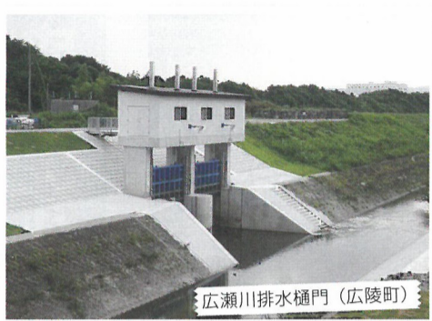
広瀬川排水樋門(広陵町)

広瀬川の合流先を葛城川からより河床の低い曾我川とするための樋門工事と河川の付け替え工事を行い、この八月から曾我川への切り替えを開始しました。今後の対策としては、来年度から、小柳小橋までの護岸工事や橋の架替え工事を進め、さらに上流に向かって継続的に事業進捗が図れるよう、用地買収を進めていく予定です。