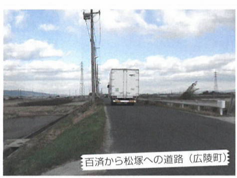
百済から松塚への道路(広陵町)

広陵町の百済寺周辺から大和高田市の近鉄大阪線松塚駅までの道路は、道路幅が狭く歩道もないため、車のすれ違いが困難で、駅に向かう歩行者や自転車も危険にさらされています。しかし、広陵町だけではこの道路の全線にわたる拡幅ができません。広陵町と大和高田市にまたがる地域でのまちづくりの推進について県の力添えを要望いたします。