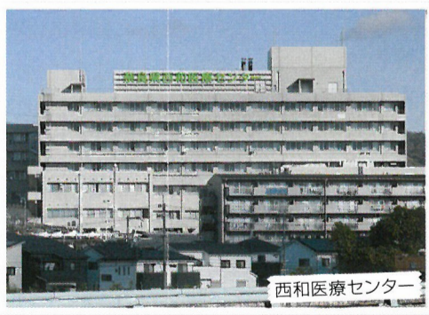
西和医療センター

には、まず経営主体の県立病院機構の経営改善が急務です。多額の累積赤字を抱える病院機構の経営改善にどのように取り組んでおられるのでしょうか。