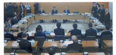
予算審査特別委員会の様子