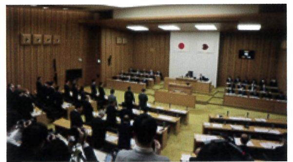
本会議で修正予算が可決

自由民主党・無所属の会が提案した「県太陽光発電施設の設置及び維持管理等に関する条例」「県行政に関する基本的な計画等を議会に議決すべき事件として定める条例」の2つの改正案はいずれも賛成多数で可決しましたが、知事から再議に付され、賛成28・反対15で再議の可決に必要な2/3に届かず否決されました。一方、総務警察委員会で可決した五條市長と地元住民から提出された「大規模広域防災拠点等の整備に関する請願書」2件は採択されました。