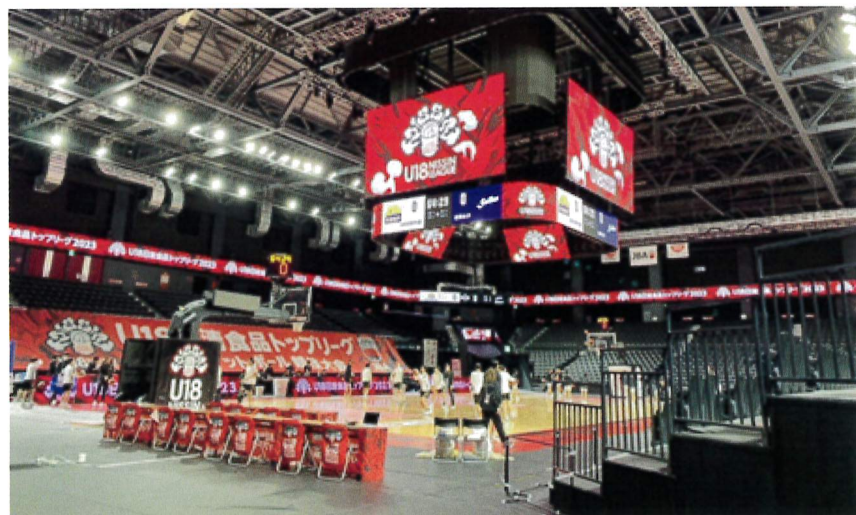
▲写真② 群馬県太田市のアリーナ(5000人収容) プロスポーツ等の利用はできるがコンサート機能は乏しいコンパクト型施設