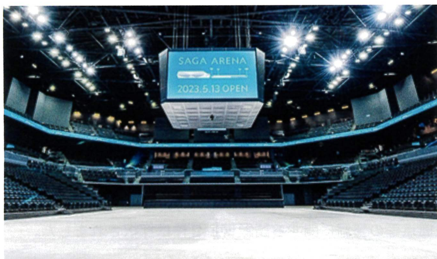
▲写真① 佐賀県のアリーナ(8400人収容) 2年先まで予約が埋まり収益性が高い大規模施設

今後は、奈良県に必要なアリーナ構想について、県の調査を注視し、提案を続けてまいります。