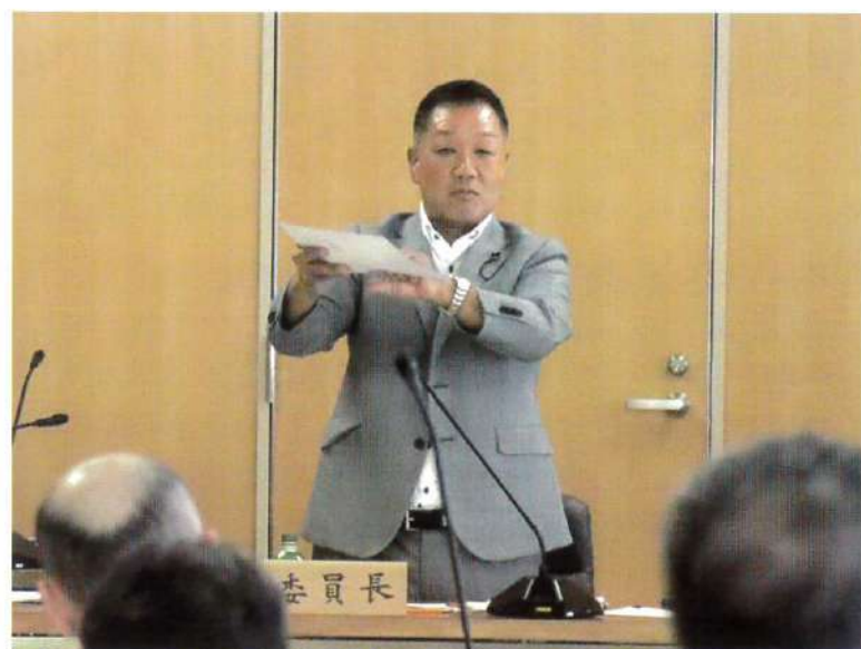
建設委員長として委員会の審議を進行

これからも北葛地域の皆様からいただくお声をもとに、道路や河川、公園など基盤整備の推進をはじめ、活力ある地域づくりに精いっぱい取り組んでまいります。